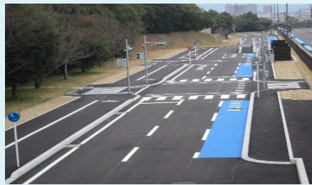
「自転車学習コース」