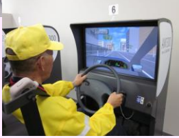
危険予測シミュレータ