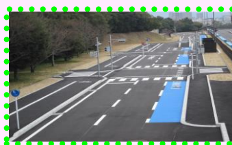
自転車学習コース