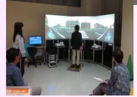
歩行環境シミュレータ

※ 季節等（夏場や冬場）に応じて、室内だけの研修カリキュラムもご用意しております。気軽に、ご相談ください。皆様のご利用をお待ちしております。