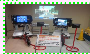
自転車シミュレーター