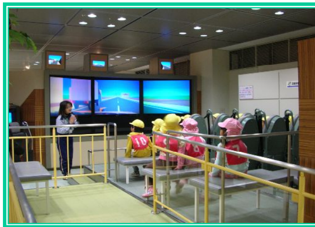
*四輪事故シミュレーションによる体験*