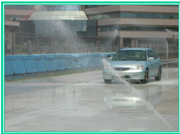
*急ブレーキによる体験*