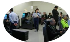
シミュレータ体験

※詳細はホームページでご案内いたします。 http://www.safetyplaza-mie.com