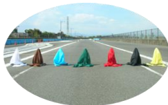
夜間の色の見え方