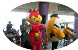
ストップビー・ミーボくん