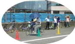
自転車の危険行為体験