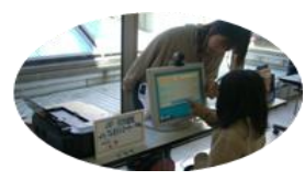
子ども免許証作成