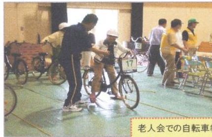
老人会での自転車教室。 しっかり足の届く自転車を選びます。