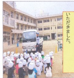
トラックでの死角実験。 担任の先生に運転席に座っていただきました。